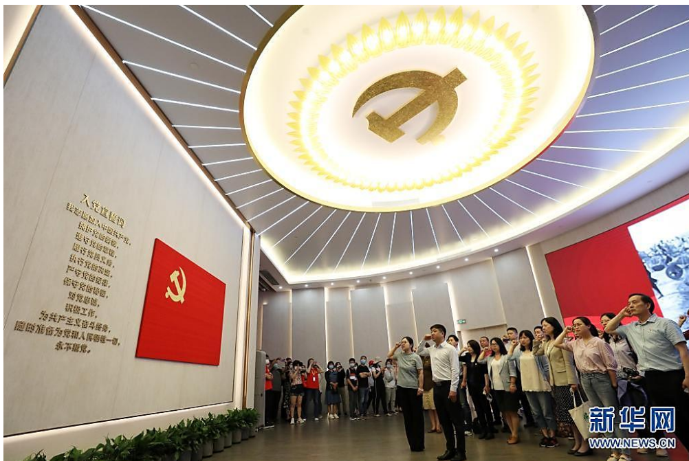
6月3日，党员在全新开馆的上海中共一大纪念馆里重温入党誓词。

“天下至德，莫大于忠。”对党忠诚，是共产党人首要的政治品质。一百年来，我们党历经艰险磨难，没有被困难压垮，也没有被敌人打倒，靠的就是千千万万党员的忠诚。百年党史，有“忠诚印寸心，浩然充两间”的坚毅，有“壮士头颅为党落，好汉身躯为群裂”的壮烈，有腹中满是草根而宁死不屈的气节，有竹签钉入十指而永不叛党的坚贞，有深藏功名、淡泊名利的境界……一代代优秀共产党员人用鲜血和生命、拼搏与奉献诠释了对党的绝对忠诚。