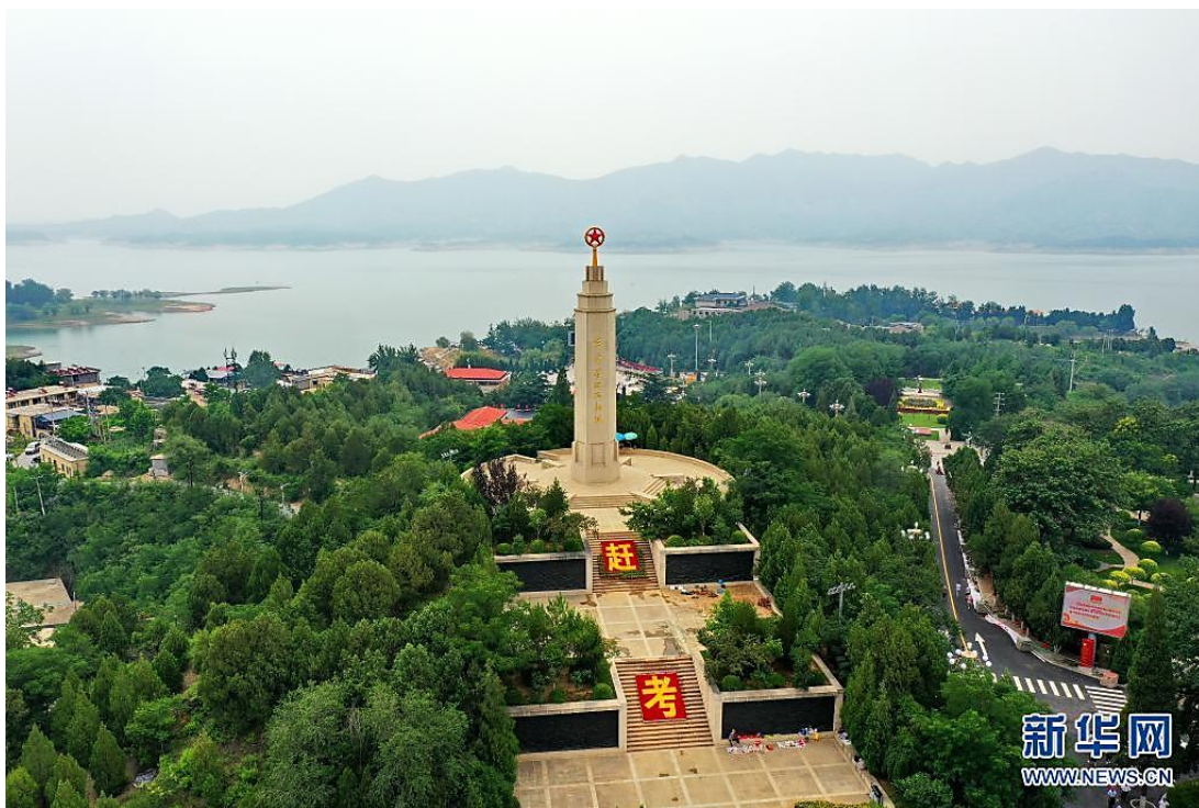
这是6月13日拍摄的河北省平山县西柏坡纪念塔（无人机照片）。

伟大建党精神思想精辟、内涵丰富、意境深远，其四个方面既相对独立、各有侧重，又紧密联系、相互融合，是相互贯通、相互促进的有机整体，充分体现了百年党史的主题和主线、主流和本质，充分体现了“不忘初心、牢记使命”这一马克思主义政党的本质要求。