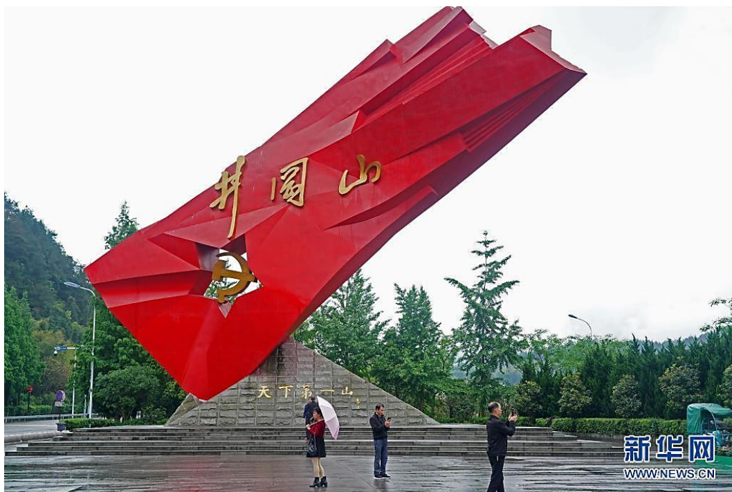
游客在江西井冈山“井冈红旗”雕塑前参观、拍照（4月27日摄）。