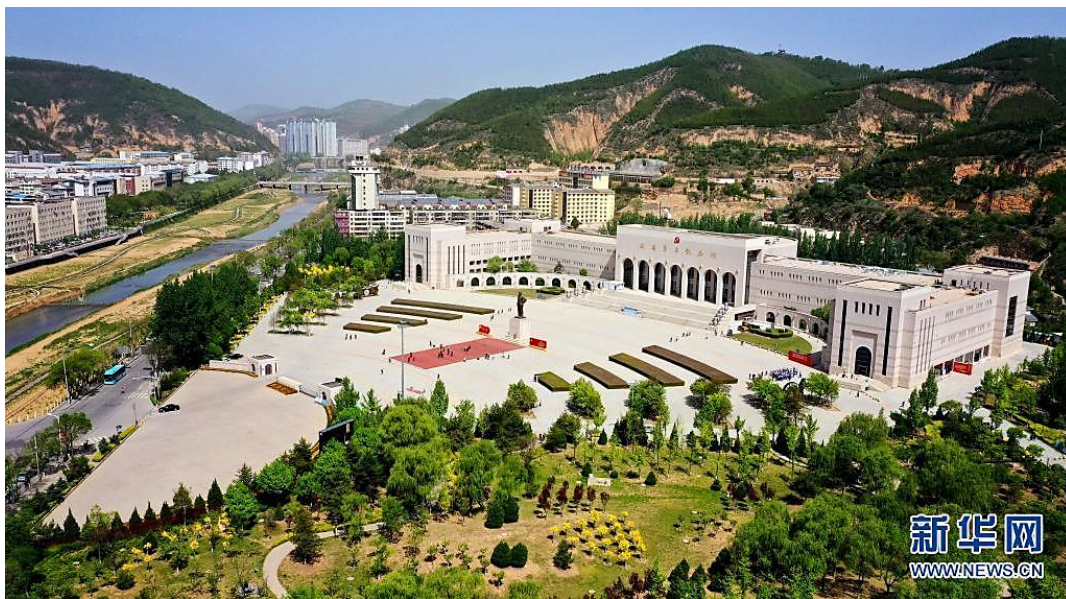
延安革命纪念馆（5月8日摄，无人机照片）。

对党忠诚，源自坚定信仰；不负人民，发自为民初心。我们党的百年历史，就是一部与人民心心相印、与人民同甘共苦、与人民团结奋斗的历史。从“为人民服务”到“以人民为中心”，中国共产党人始终把人民放在心中最高位置，为了人民幸福，勇往直前以赴之，艰苦奋斗以求之，殚精竭虑以成之，真正做到了“我将无我，不负人民”。