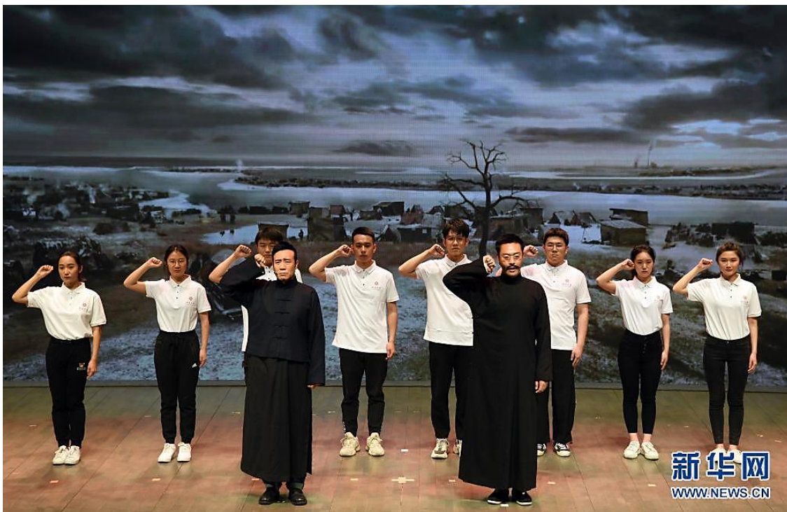
电视剧《觉醒年代》主创团队走进北京大学，剧中主要演员与北大学生同台演出（4月20日摄）。

“未惜头颅新故国，甘将热血沃中华。”党的百年历史，就是一部不怕牺牲、英勇斗争的历史。青史之中，有血泪斑斑，有苦难辉煌，更有铁骨铮铮。