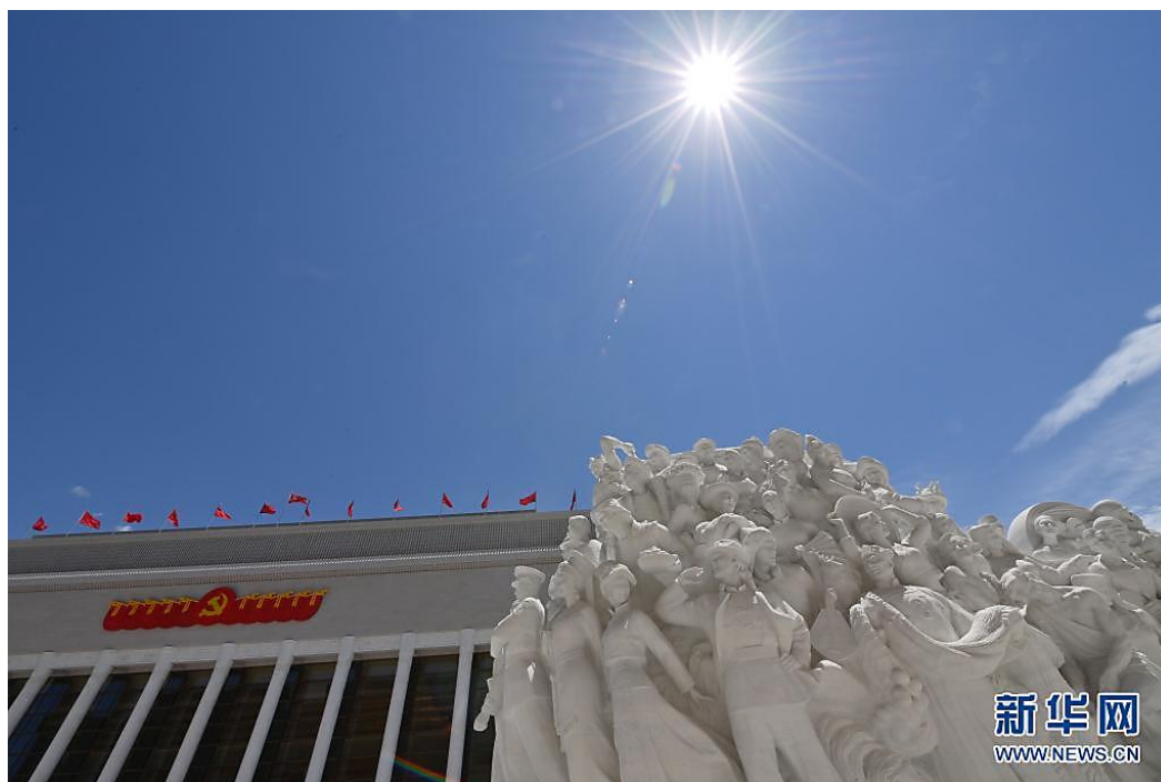
这是中国共产党历史展览馆（6月18日摄）。

习近平总书记对伟大建党精神进行的提炼总结和深刻阐发，阐释了中国共产党的精神源头和起点，揭示了伟大建党精神的历史意义和时代价值，集中体现了对党的历史、党的传统、党的精神的深刻论述。