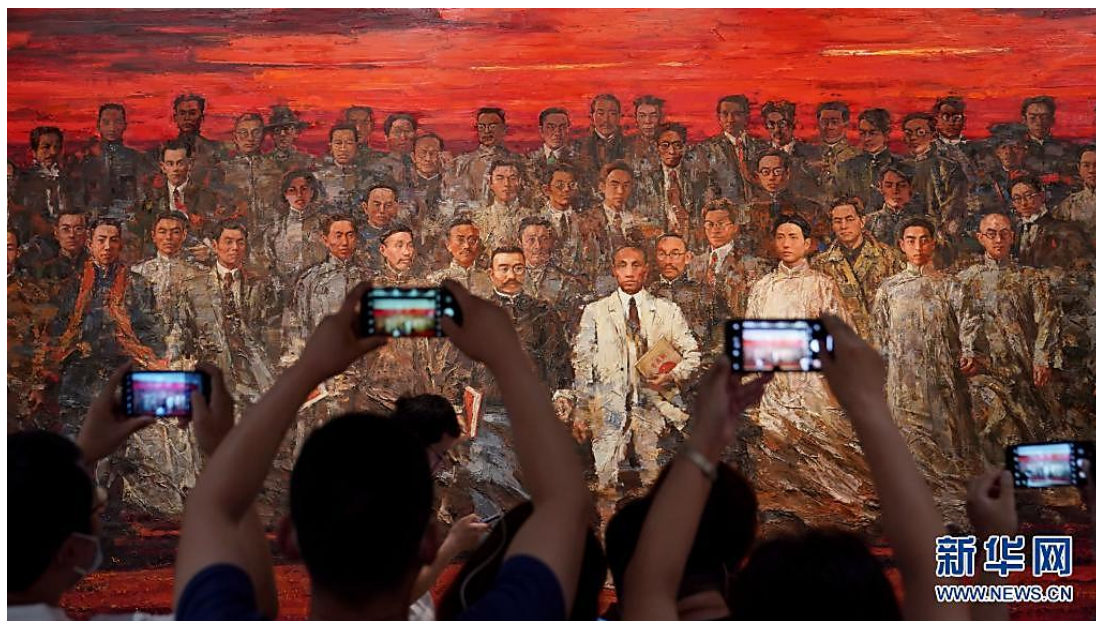
参观者在中共一大纪念馆内拍摄油画作品《星火》（6月6日摄）。

“人生最高之理想，在求达于真理。”翻开党史，党的先驱们书写了一个个坚持真理、坚守理想的感人故事。为了心中的主义和信仰，他们矢志不渝、前赴后继，生死考验不能改其志，功名利禄不能动其心，千难万险不能阻其行。“石可破也，而不可夺坚；丹可磨也，而不可夺赤。”中国共产党人的理想信念坚如磐石，中国共产党人的拼搏奋斗百折不挠。