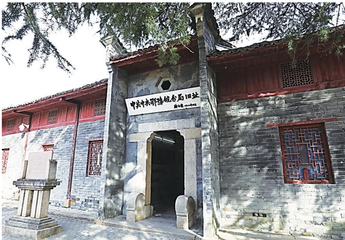
中共中央鄂豫皖分局旧址

大别山位于湖北、河南、安徽三省交界处，东临江淮平原，西临平汉铁路，南接长江，北接淮河，是我国中部地区自西向东蜿蜒于长江和淮河之间的一条重要山脉。大别山不仅是一座绿色的山，更是一座红色的山、一座革命的山、一座英雄的山。从1921年中国共产党诞生到1949年新中国成立，党领导大别山区人民创造了“28年红旗不倒”的革命奇迹，以巨大的牺牲赢得了中国共产党的重要建党基地、中国革命的主要活动地、人民军队的重要诞生地、中国革命的战略转移地等崇高的历史地位。