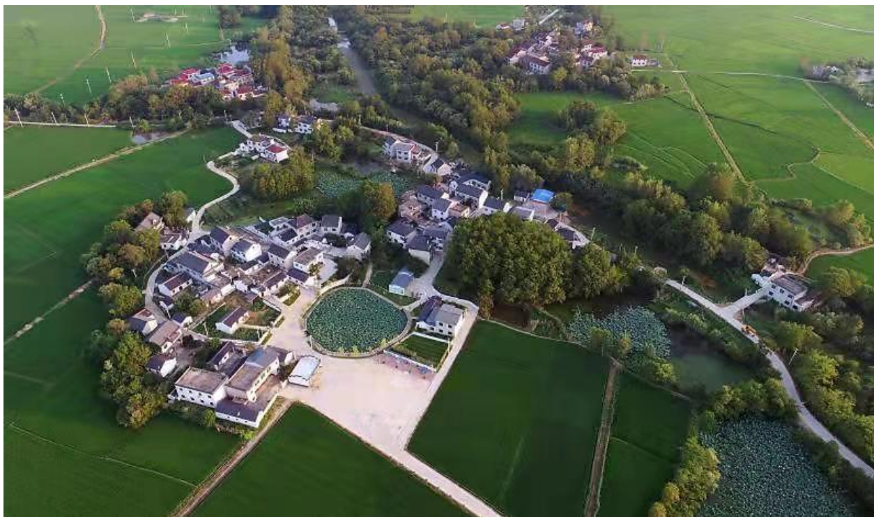
龙湖村位于安徽省安庆市潜山市王河镇，有“鱼米之乡”之称，盛产水稻、油菜、莲藕等。清澈的水塘，整齐的民居，一幅生态宜居、宁静祥和的乡村画卷呈现在人们眼前。