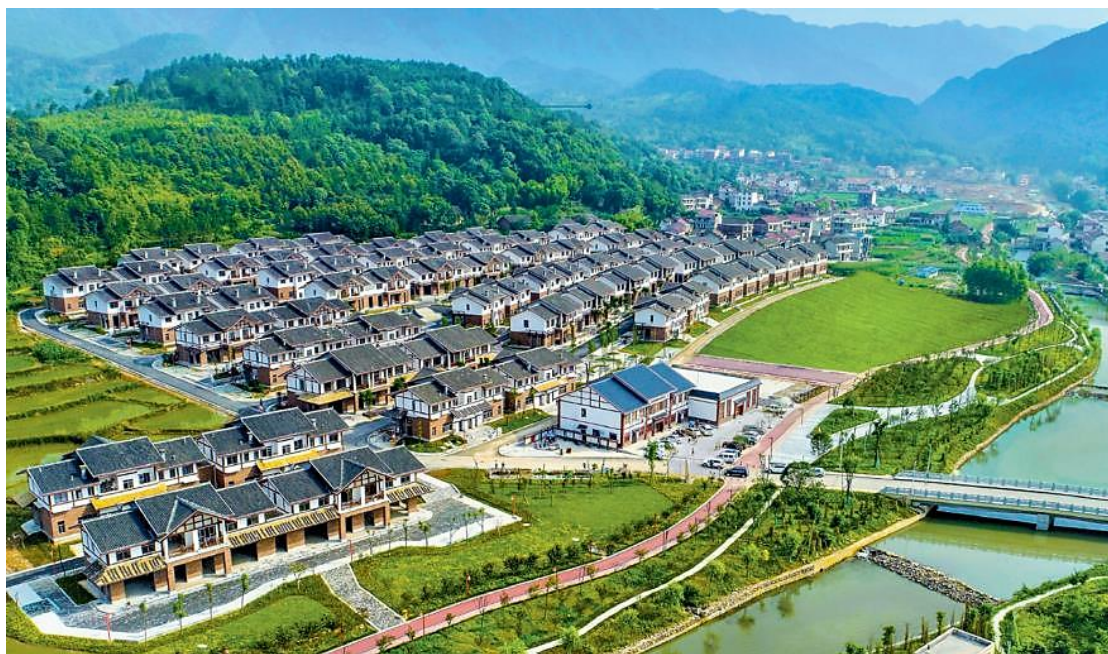
湖南省新邵县潭府乡易地扶贫搬迁集中安置点。

深刻领会以人民为中心的发展思想，站稳人民立场。全会指出，党的根基在人民、血脉在人民、力量在人民，人民是党执政兴国的最大底气。2021年7月，习近平总书记对农村厕所革命作出重要指示，强调要发挥农民主体作用，注重因地制宜、科学引导，坚持数量服从质量、进度服从实效，求好不求快，坚决反对劳民伤财、搞形式摆样子，扎扎实实向前推进。这不仅是对农村厕所革命的要求，也是对推进乡村振兴提出的要求。我们必须牢固树立“乡村振兴为农民而兴，乡村建设为农民而建”的理念，从农村实际入手，从农民需求入手，真正让农民群众成为乡村振兴的参与者、建设者和受益者。