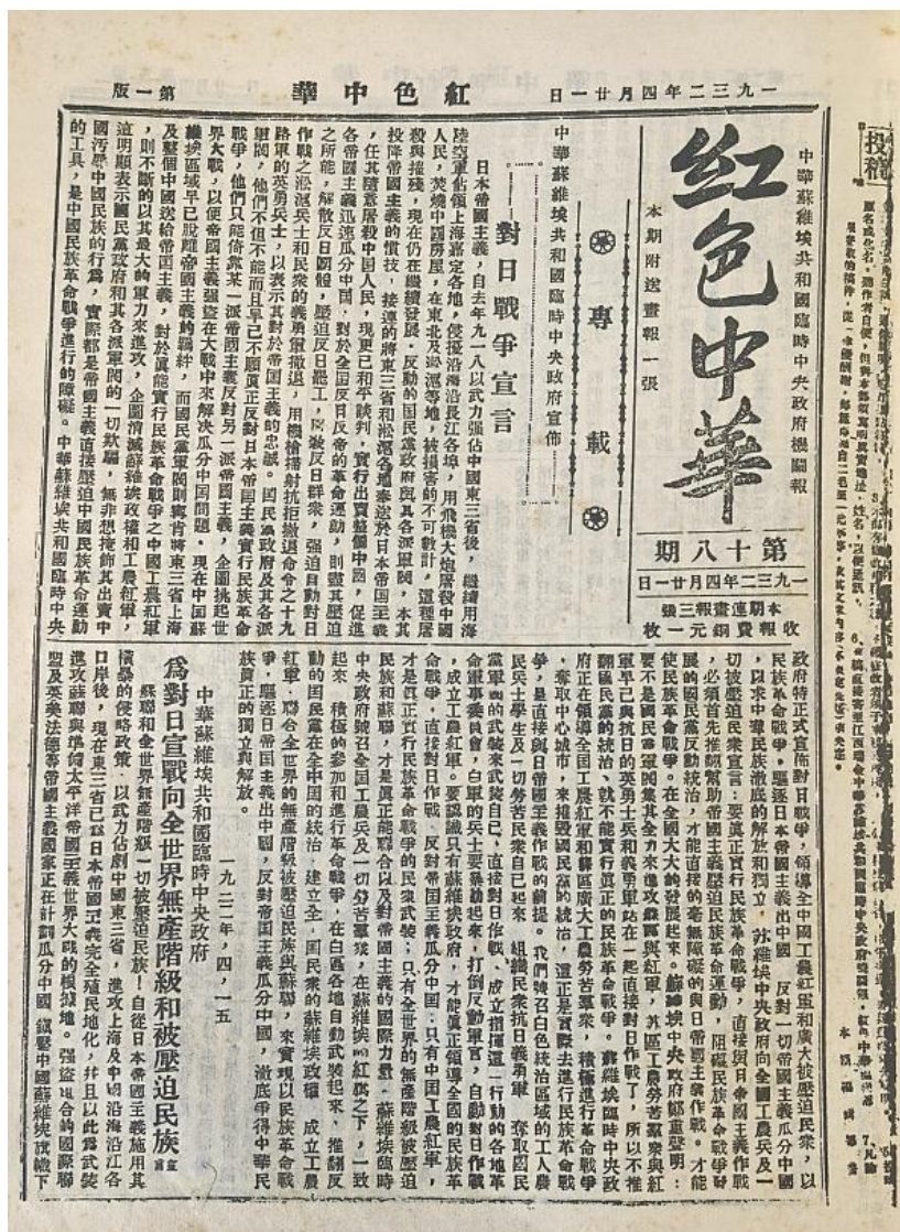
1932 年 4 月 21 日，《红色中华》报公开发表《中华苏维埃共和国临时中央政府宣布对日战争宣言》

1932 年 4 月 15 日，《中华苏维埃共和国临时中央政府宣布对日战争宣言》（以下简称《宣言》）在江西瑞金发布，这是中国共产党领导的工农民主政权第一份抗日檄文，标志着我们党及其领导的苏维埃政府公开对日宣战，展现了中国共产党以民族大义为重、率先扛起抗日大旗的历史担当。