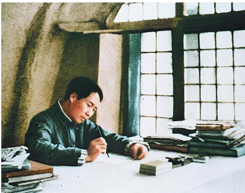
图为 1938 年，毛泽东同志在延安窑洞撰写《论持久战》（资料照片）。

北平、天津、上海、南京等大城市已经陷落，大片国土沦丧于日寇铁蹄之下，对抗战失去信心者大肆渲染悲观主义情绪，“亡国论”甚嚣尘上。另一方面，八路军一一五师取得平型关首胜，国民党军队取得台儿庄大捷，“速胜论”也发生了，有的人甚至盲目乐观地认为徐州战役就是“准决战”，“就是敌人的最后挣扎”。面对扑朔迷离的战局，抗战进程究竟会如何发展？中国能否取得最后胜利？众说纷纭，莫衷一是。也有不少有识之士认识到抗日战争将是持久战，但为什么是持久战？怎样才能取得最后胜利？这些疑虑并未得到有说服力的回答，整个中国都急切期待着正确理论指引。