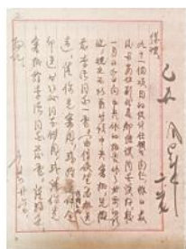
李富春关于九十一个项目设计任务书问题给周恩来的报告