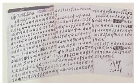
1953年6月，周恩来关于编制第一个五年计划报告的修改问题致毛泽东等的信（中央档案馆藏）

从1953年第一个五年计划起步，到如今第十五个五年规划的蓝图擘画，一幅绵延70余载的社会主义现代化建设画卷在中国共产党人的手中接力绘制、渐次铺展。俗话说“万事开头难”，新中国第一个五年计划的编制经历了异常艰辛的过程。中央档案馆保存的毛泽东、周恩来、陈云等新中国第一代党和国家领导人关于编制实施“一五”计划的书信、手稿、会议记录等珍贵档案，为我们还原了那段白手起家、艰难创业的历史。