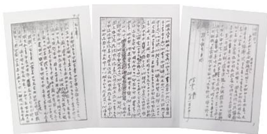
1952年7月，陈云关于制定第一个五年计划草案准备工作情况给毛泽东的报告