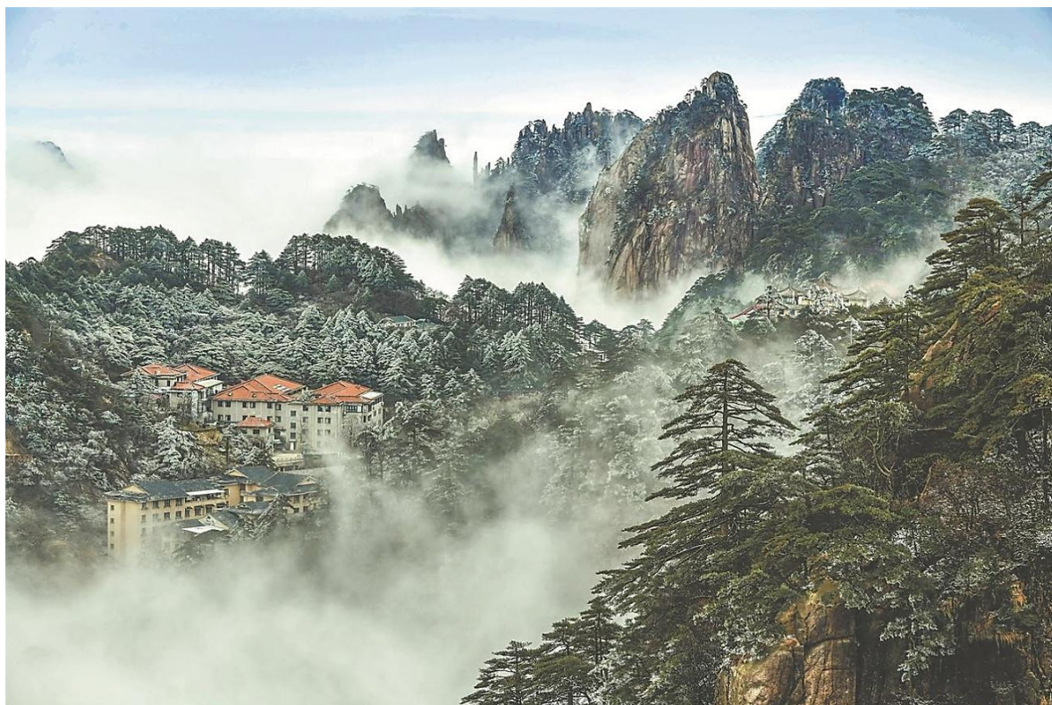
黄山云海雾松

✚ 2月23日，福建省新闻舆论工作会议暨重要舆论阵地开展增强“四力”教育实践工作培训班开班式在省委党校举办。省委常委、秘书长、宣传部长梁建勇出席并讲话。