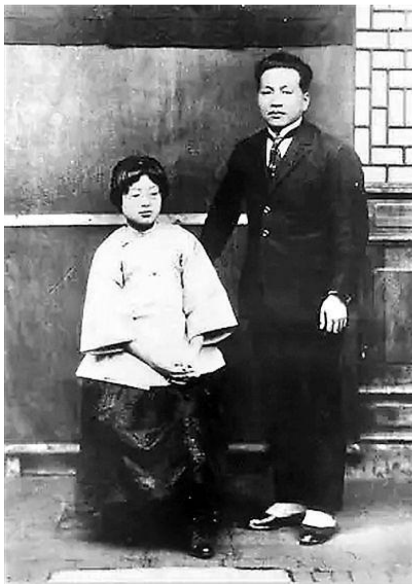
刘伯坚与王叔振合影