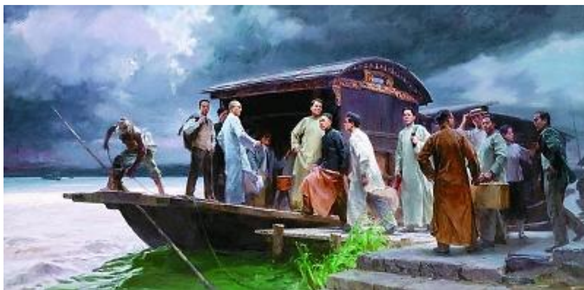
启航（油画）何红舟、黄发祥