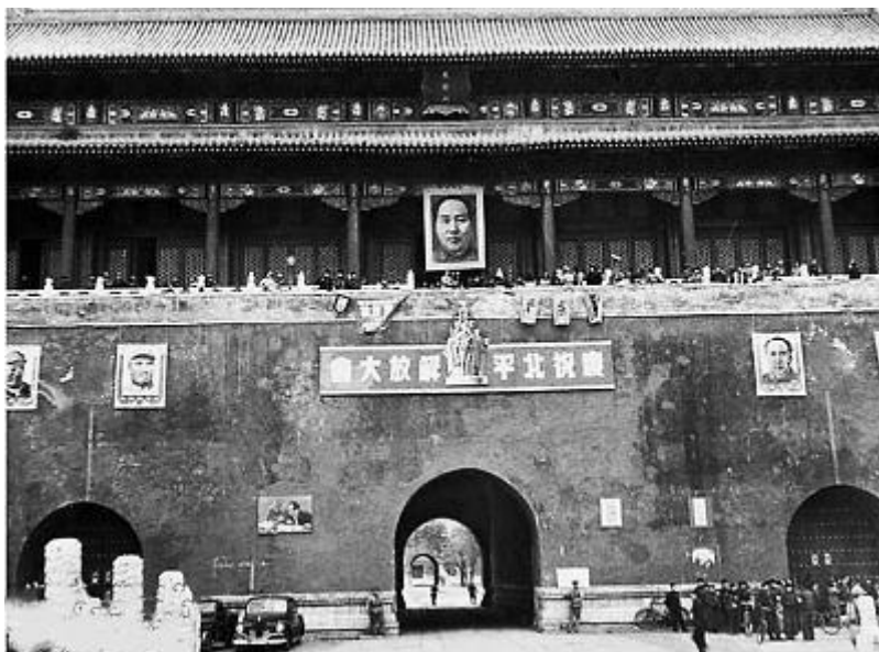
庆祝大会主席台——天安门城楼

70年前，1949年的元宵节，北风呼啸，气候寒冷，但是北平市人民的心里却是暖融融的。大街小巷，家家户户都把大红灯笼高高地挂了起来，人们一大早便从四面八方汇集到天安门广场，参加庆祝北平解放大会。中共晋绥分局机关报《晋绥日报》1949年2月16日以“北平人民的狂欢节日”为题，援引新华社2月12日的报道说：“今天元宵佳节，北平市20余万人大集会，狂欢庆祝解放。”