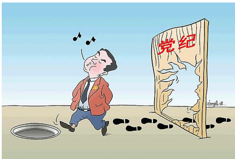
走过路过不能“错”过 王琪/画