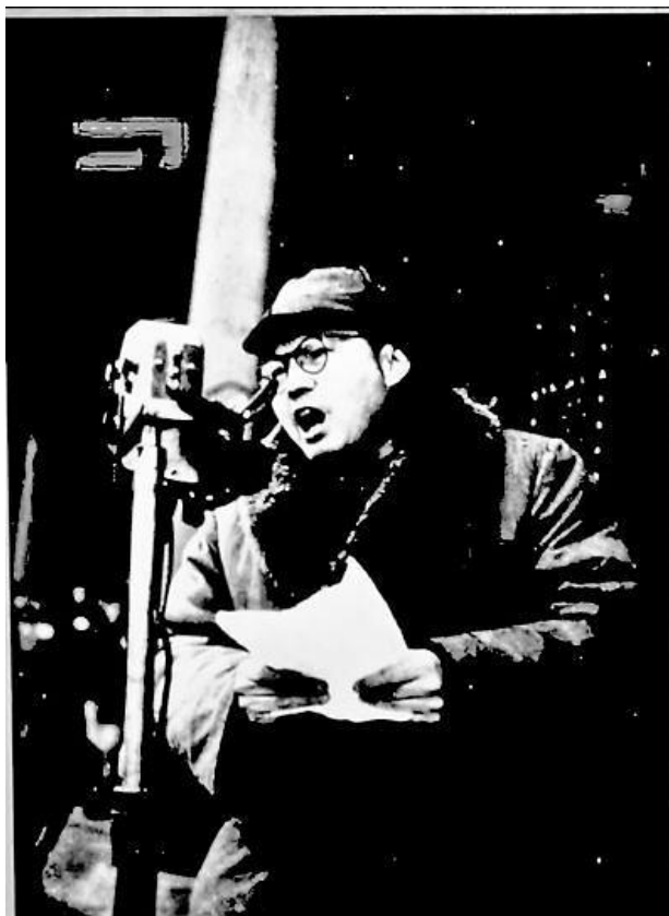
叶剑英在庆祝北平和平解放大会上

最引人注目的是北平艺专的师生们，他们抬来了连夜绘制成的八幅六尺宽、八尺长的领导人肖像和宣传漫画，其中有毛泽东主席和朱德、聂荣臻、叶剑英等将军像。主笔是董希文，他成为绘制天安门城楼毛主席画像的第一代画家。这些领导人画像同时悬挂在主席台所在的天安门城楼上，毛泽东的画像悬挂在居中上方位置。挂上这么多领导人的画像，这是天安门自建成后第一次，也是唯一的一次。城门上挂着写有“庆祝北平解放大会”几个金字的红色横幅，中间有“工、农、兵、学、商”塑像，工人、农民高举斧头、镰刀，一颗红星挂在雕像上方。