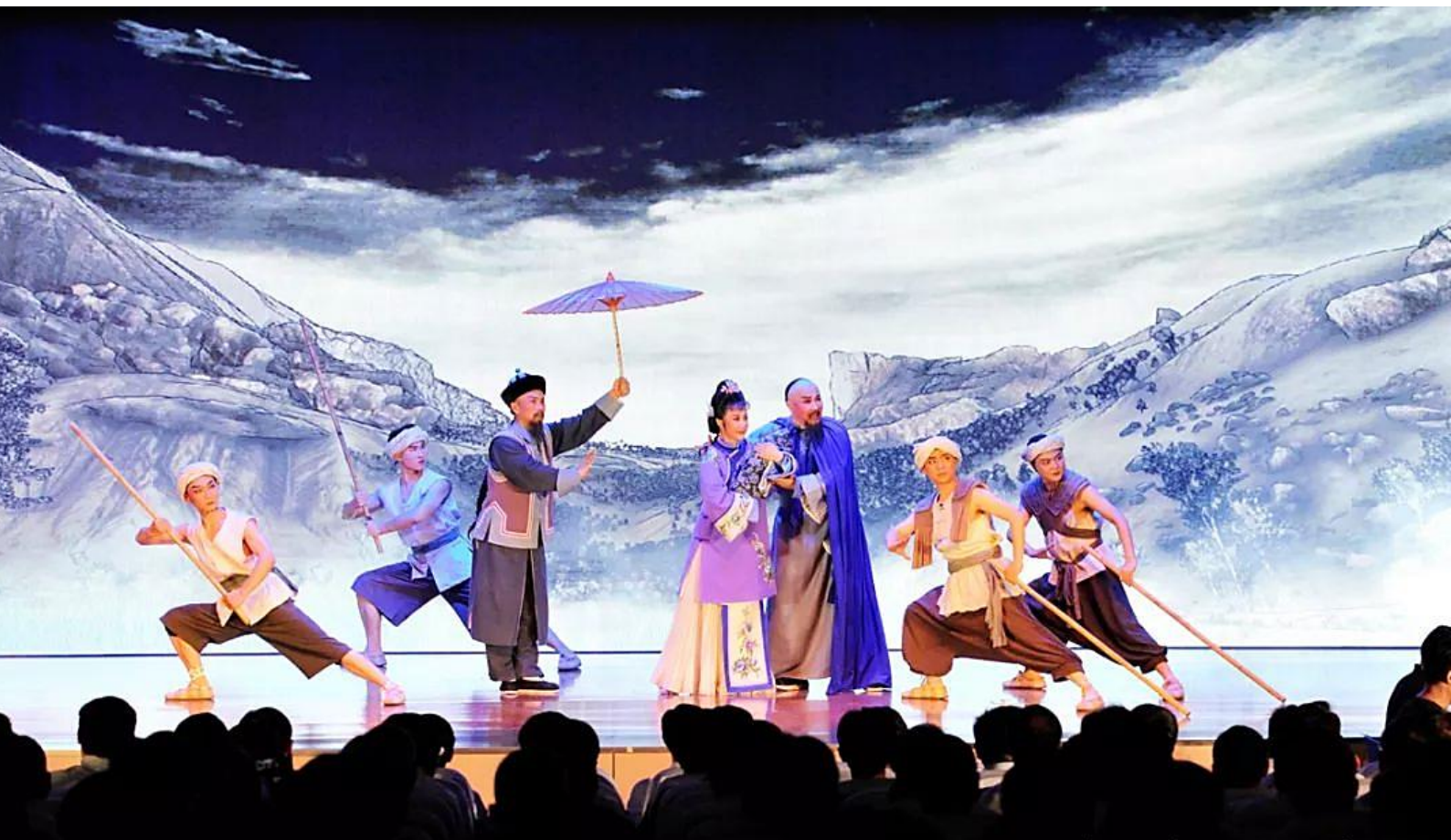
黄梅戏《不越雷池》在省委党校（安徽行政学院）精彩上演 江淼/供稿