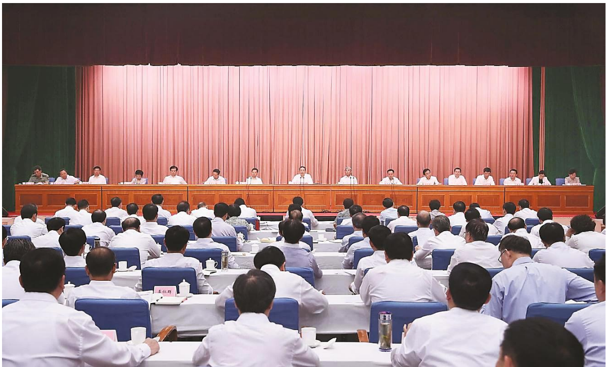
6月6日上午，全省“不忘初心、牢记使命”主题教育工作会议在合肥召开。