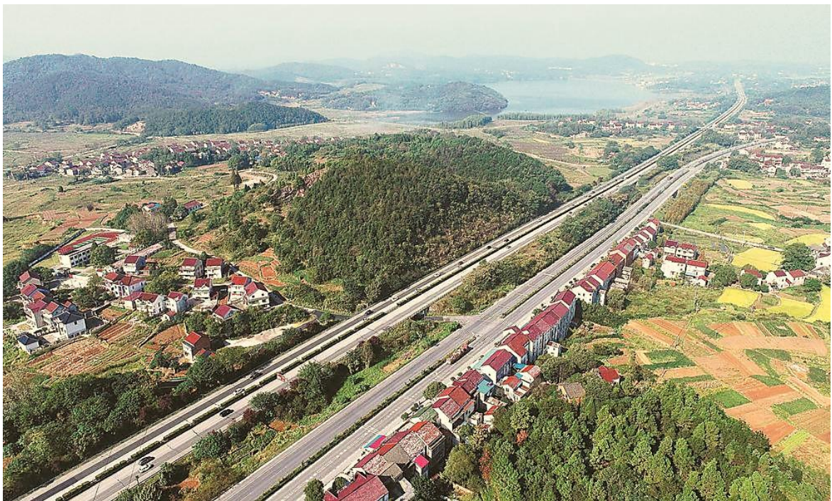
近年来，庐江县大力推进“四好农村路”建设，促进农村路网提档升级。图为车辆在庐江县罗河镇境内 G3 高速和 G330 国道上有序行驶。