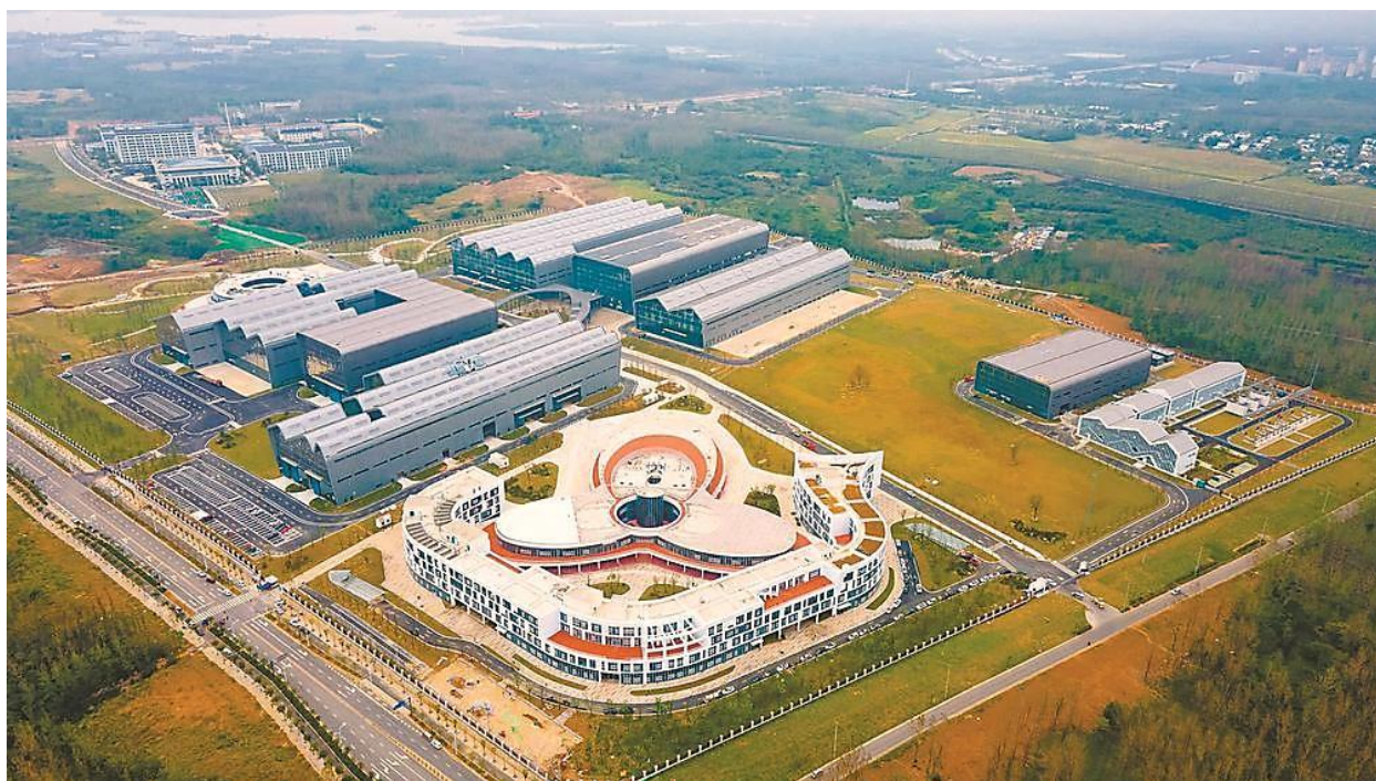
位于合肥市庐阳区三十岗乡的国家大科学装置“聚变堆主机关键系统综合研究设施”园区。